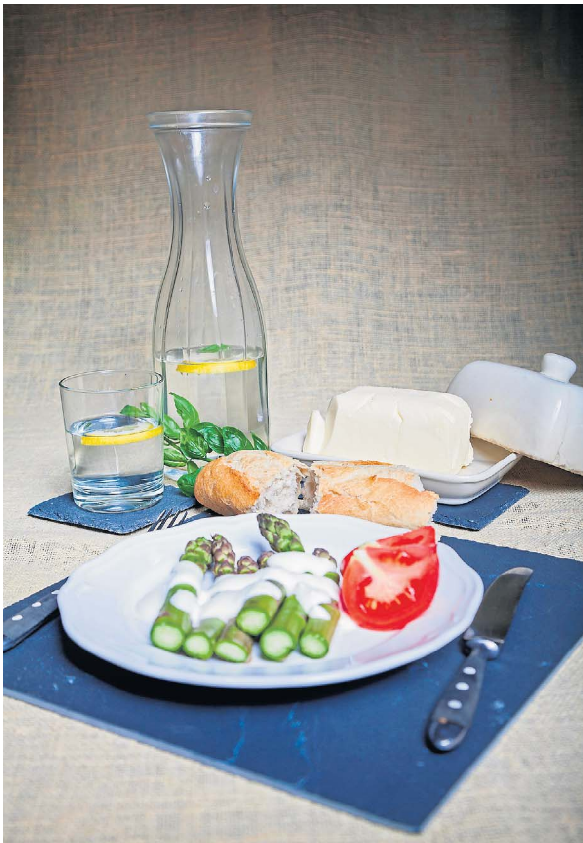
Projekt „Made in Małopolska” wzmacnia i przypomina o licznych i potwierdzonych walorach wód z naszego regionu