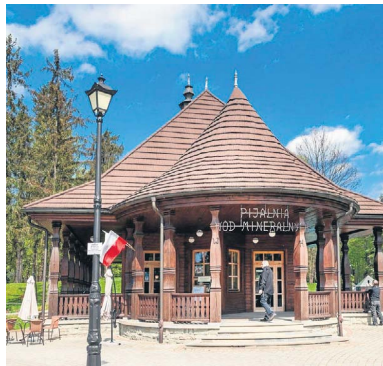
Pijalnia Wód Mineralnych w Wysowej-Zdroju