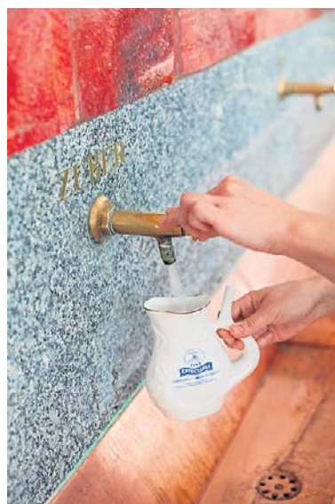
Pijalnia Główna w Krynicy-Zdroju