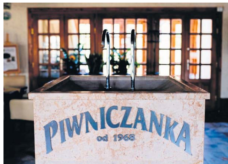
Uzdrawisko w Piwnicznej-Zdroju

gólnie polecamy te największe - w Wieliczce i Rabce Zdroju.