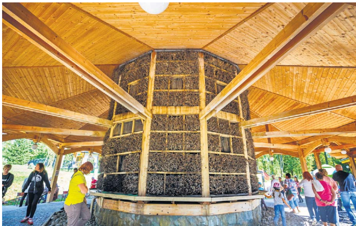
Tężnia solankowa w Rabce-Zdroju